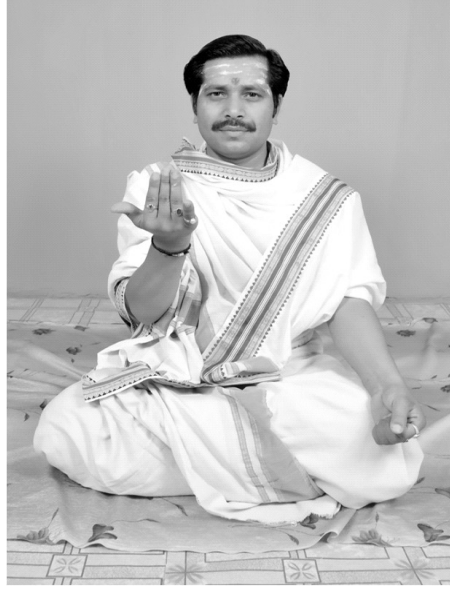
चित्रसंख्या [ 11, क ]

रेखाबिन्दु द्वयस्यान्तरधोरेफसमा च या। बलिकां तत्र जानीयात् कनिष्ठायाश्च क्षेपणम्। 21 पुरुषः (वा. सं. 31/1) मध्ये मूलस्थाने हस्तः।