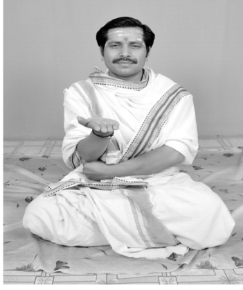
चित्रसंख्या [ 13, ग ] हस्तदोषः स्फुटः