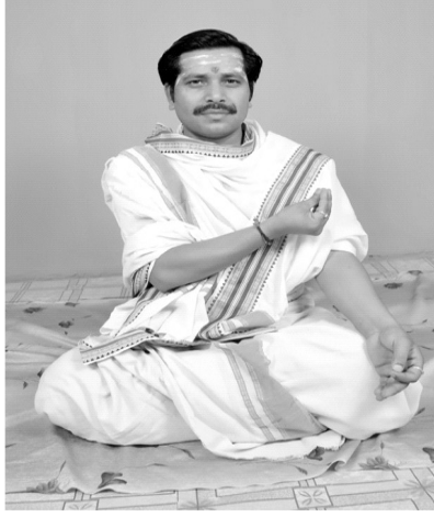
चित्रसंख्या [ 8, ग ]

‘गायत्री त्रिष्टुप्’ (वा. सं. 23/33) पकारे पञ्चाङ्गुलीनां मेलनम्।