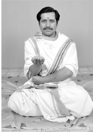
चित्रसंख्या [ 13, ख ] हस्तदोषः नौका