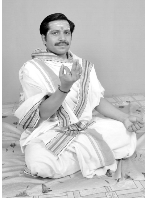
चित्रसंख्या [ 8, घ ]

तर्जन्यङ्गुष्ठयोरग्रमेलनात् तकारे कुण्डलाकृतिः भवति।