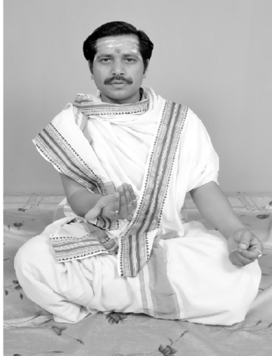
चित्रसंख्या [ 6, क ] पूर्वस्थितिः

एते अनुदात्तपूर्वा उदात्तपराः सन्तः पूर्णन्युब्जाः भवन्ति।