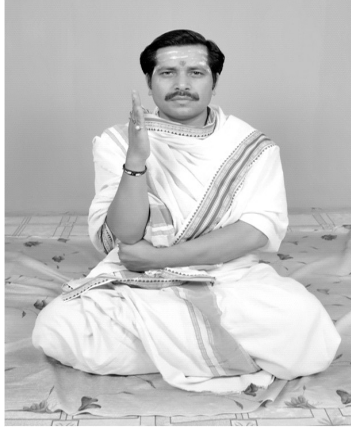
चित्रसंख्या [ 13, घ ] हस्तदोषः दण्डः