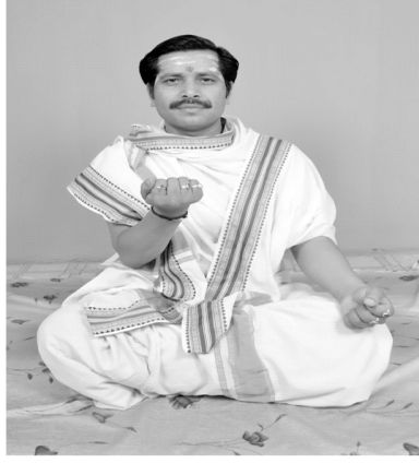
चित्रसंख्या [ 13, च ] हस्तदोषः मुष्टिः