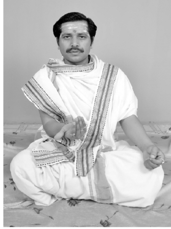
चित्रसंख्या [ 5, क ]

एतेषु चतुर्षु हस्तः हृदयं प्रति गत्वा बहिरायाति चित्रत्रयेन अयं भागः प्रदर्श्यते। एते चत्वारः उदात्त परत्वाभावात् अर्धन्युब्जाः भवन्ति।