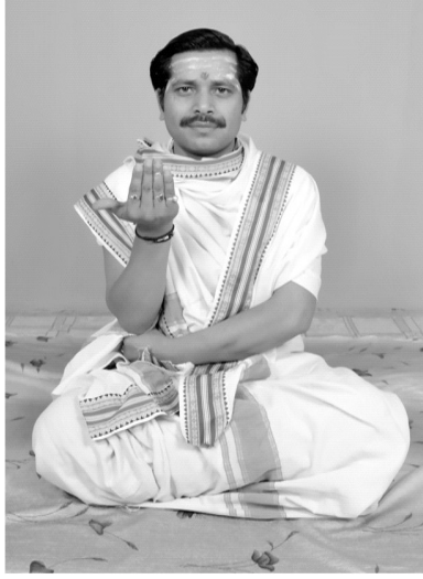
चित्रसंख्या [ 5, ग ]

उदात्तपरभूते यथा-‘भूर्भुवः स्वर्द्यौरिव’ इति जात्यः। (वा. सं. 3/5)