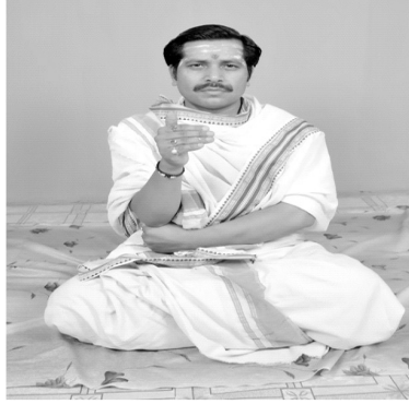
चित्रसंख्या [ 13, छ ] हस्तदोषः परशुः