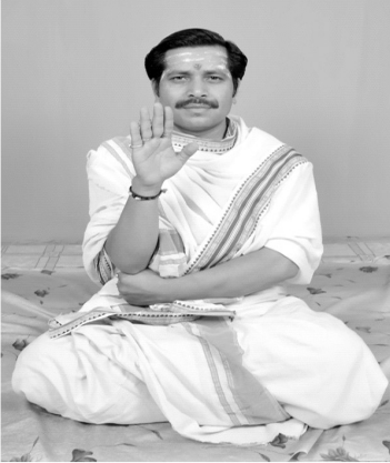
चित्रसंख्या [ 13, ङ ] हस्तदोषः स्वस्तिकः