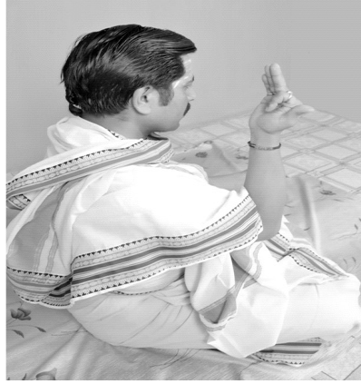
चित्रसंख्या [ 8, क ]