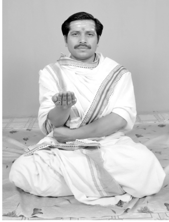
चित्रसंख्या [ 13, क ] हस्तदोषः चुलुः

तथा च सम्प्रदायप्रबोधिनी शिक्षाकारेण तथाङ्गुल्याः प्रदर्शनम्' इति पाठः वर्द्धितः तस्मात् अष्टौ दोषाः हस्तस्यावश्यमेव वर्जनीयाः तेषां मुद्राः चित्रेण साकं प्रदर्श्यन्ते-