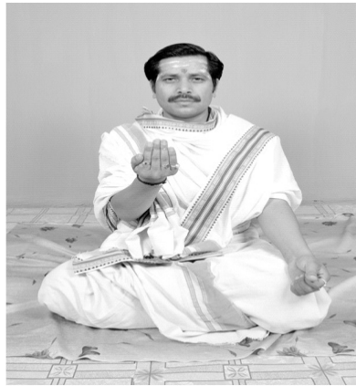
चित्रसंख्या [ 8, ख ] तर्जन्यङ्गुष्ठमेलनात् श्रकारः