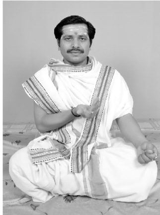
चित्रसंख्या [ 5, ख ]