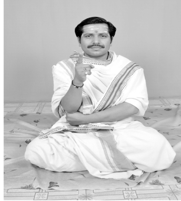
चित्रसंख्या [ 13, ज ] हस्तदोषः अङ्गुलीप्रदर्शनम्